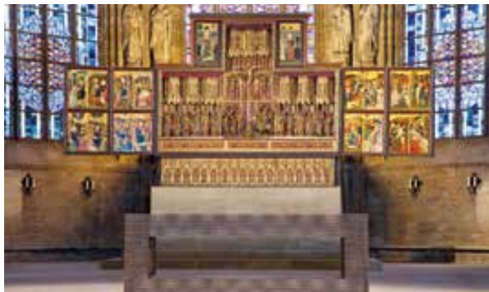
Altarretabel der Ev. Stadtkirche St. Reinoldi, Foto: Rüdiger Glas 2020

Seit fast 600 Jahren zeugt das heute nahezu einzigartige Altarretabel der Ev. Stadtkirche St. Reinoldi vom selbstbewussten Auftreten der Dortmunder Ratsherren im Mittelalter.